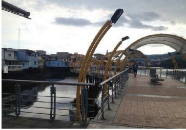
Guayaquil Municipality, Malecón del Estero, 2009, Guayaquil, Ecuador.