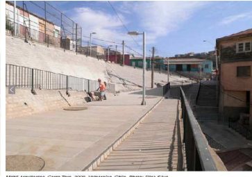
MADDF Arquitectos, Cerro Tolo, 2009, Valparaíso, Chile.