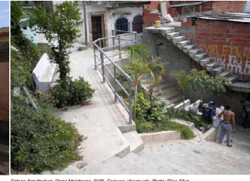
Enlace Arquitectos, Plaza Maízbarros, 2009, Caracas, Venezuela.