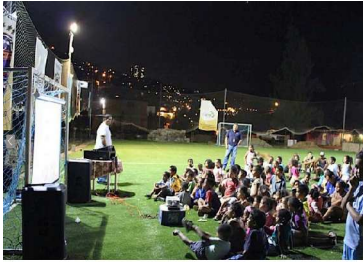
Sucre Municipality, rowles in the street, 2013, Caracas, Venezuela.