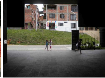
© Alalana Architects, Parque Biblioteca Fernando Botero, 2009, Medellín, Colombia.