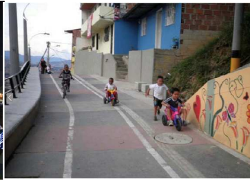
Empresa de Desarrollo Urbano EDU, Barrio Integridad Escalators, 2012, Medellín, Colombia.